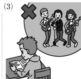
go / 否定文