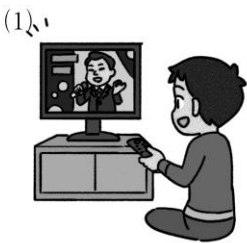
watch / 疑問文