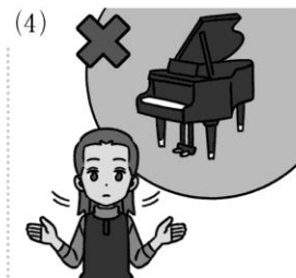
play / 否定文