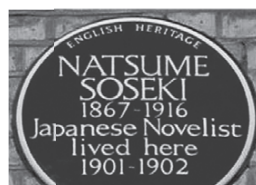
夏目漱石の下宿先を示す標識 (ロンドン)