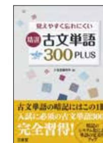
『古文単語300PLUS』(三省堂編修所編)

三省堂刊行の『古文単語300PLUS』をフラッシュカードで利用することができます。