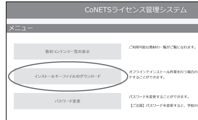
D: 「ライセンス管理システム」内の「インストールキーファイルのダウンロード」ボタン