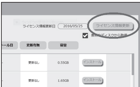
C: セットアップ画面→「教材管理」内の「ライセンス情報更新」ボタン