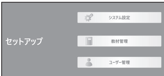
A: セットアップ画面