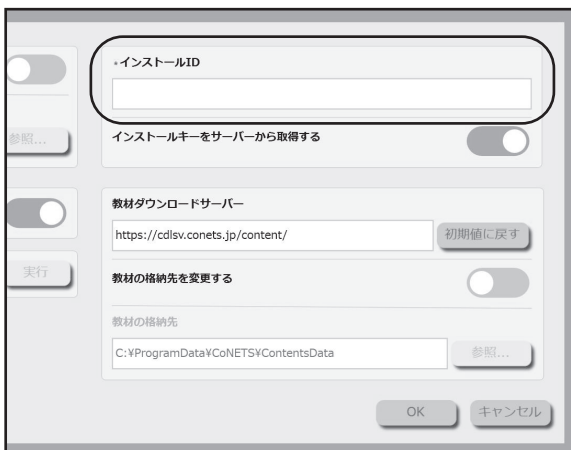
B: セットアップ画面→「システム設定」内の「インストールID」入力欄