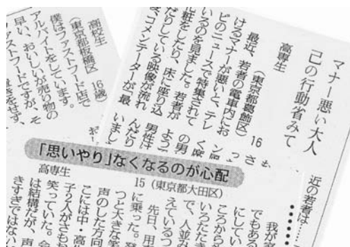
筆者が平成16年度に取り組んだ授業で、新聞に掲載された3名の投書。