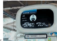
2022年の英証実験の様子

In the field test at the station, Ekimatopeia received a positive response from deaf and hard-of-hearing people. People in general also liked Ekimatopeia because it is useful for everyone, including elderly people.