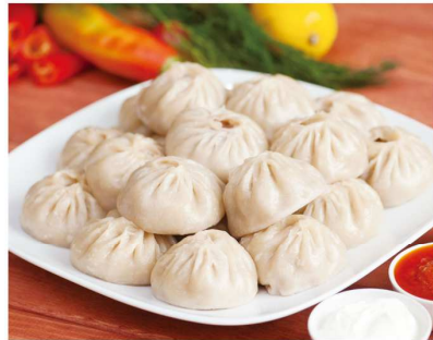
buuz ボーズ (Mongolia モンゴル) 小麦粉で作った皮でひき肉を包んで蒸した、餃子のような食べ物。