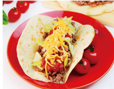
tacos タコス (Mexico メキシコ) トウモロコシから作った皮に具をのせ、サルサ(ソース)をかける。