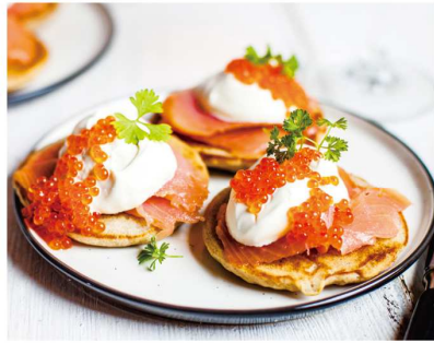
blini ブリナイ (Russia ロシア) サーモンやイクラ、ジャムなどと食べるパンケーキ。