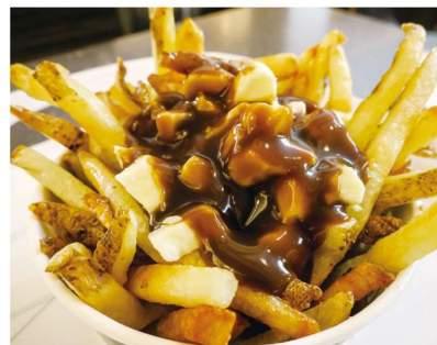
poutine プーティン (Canada カナダ) フライドポテトにチーズをのせ、肉汁のソースをかけたもの。