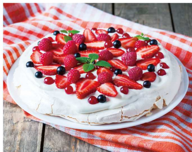
pavlova パブロバ (New Zealand ニュージーランド) メレンゲを焼いてクリームと果物で飾ったデザート。