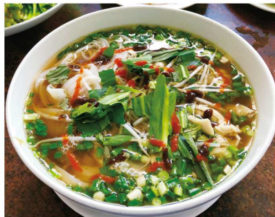
pho フォー (Vietnam ベトナム) 米粉の麺をスープに入れ、肉や香草を入れた麺料理。