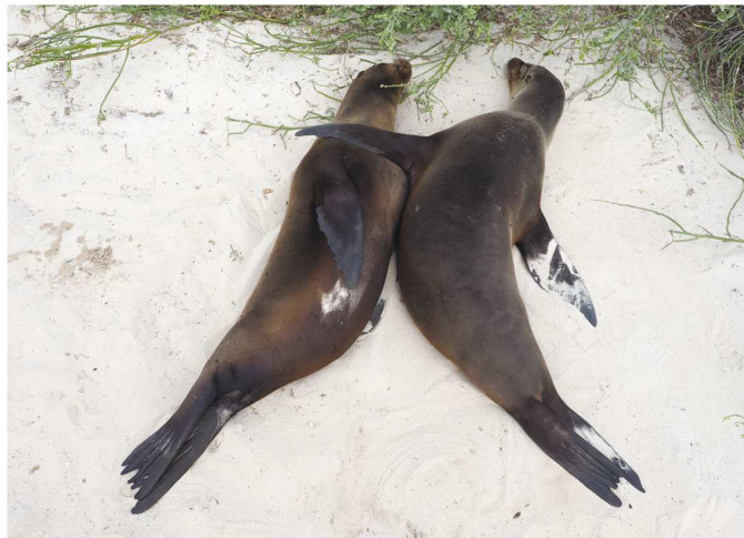
ガラバゴスアシカ