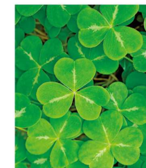
シャムロック(三つ葉植物の総称)はアイルランドの象徴