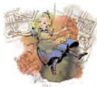
1年 Alice and Humpty Dumpty