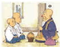
2年 A Pot of Poison