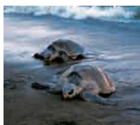
2年 Costa Rica