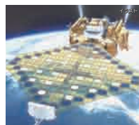
3年 Learning from Nature